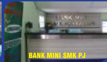
BANK MINI SMK PJ