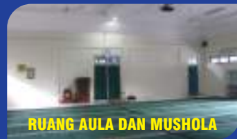
RUANG AULA DAN MUSHOLA